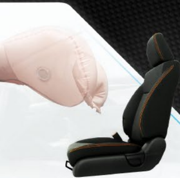
DUAL FRONT SRS AIRBAGS

Bagi Honda kegembiraan dan keseruan berkendara, harus didukung dengan sistem keselamatan yang baik. Inilah prioritas Honda yang hadir pada New Honda Jazz memberikan perlindungan optimal untuk Kamu saat berkendara.