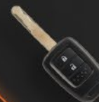
WAVE KEY + KEYLESS ENTRY